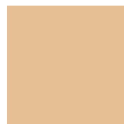
SUNNY BEIGE 56