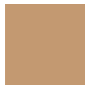
HONEY BEIGE 61